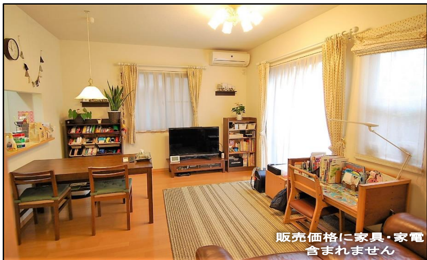
販売価格に家具・家電含まれません